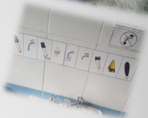
Центр развития речи