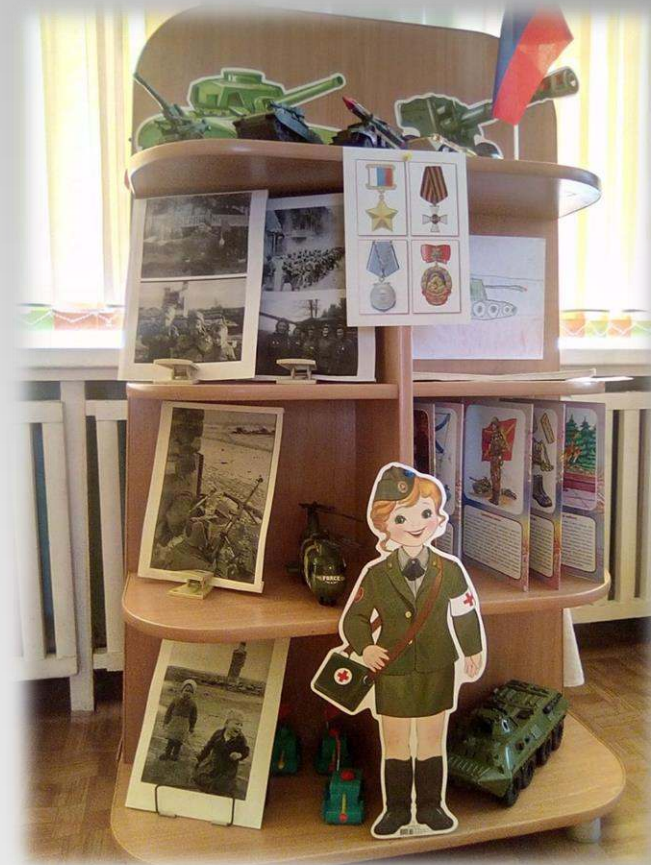
Изменение наполняемости центров в зависимости от темы недели